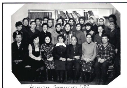
Коллектив Яльчикской ЦБС

Реализуя Указ Президента Чувашии Н.В.Федорова от 7 апреля 2003 года №34 «О создании сельских модельных библиотек в Чувашской Республике», в сентябре 2003 года на базе центральной библиотеки открыта первая сельская модельная библиотека в районе. Сегодня жителей Яльчикского района обслуживают 23 структурные подразделения ЦБС.